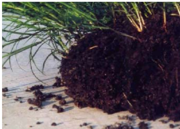
Figura 2: Prueba a gran escala de estabilización de lodos residuales con plantas

En muchos países, el uso de lodos residuales en la agricultura es impedido ya sea por la complejidad de la tecnología de procesamiento o por la baja calidad de los lodos residuales que despierta muy poco interés entre los agricultores para su uso como acondicionador de suelos. Por este motivo, GTZ ha apoyado en Egipto una prueba de campo a gran escala, llevada a cabo por la Consultora IPP, de un proceso de mejoramiento o estabilización de aguas y lodos residuales usando pólderes de pasto o juncos comunes. Los resultados son prometedores y el procedimiento será introducido en otros proyectos de GTZ en curso en Kafr el Sheik en Egipto y en Malí: