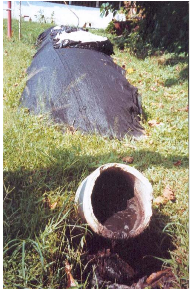
Figura 6: Un tipo común de planta productora de biogás en Cuba formada por un largo túnel de plástico con una entrada y una salida de concreto

Para atender esta situación, un proyecto de investigación ecosan apoyado por GTZ está conduciendo pruebas de campo con varios sistemas domésticos de saneamiento para encontrar soluciones tecnológicas apropiadas que puedan producir energía para la cocción de alimentos. Por ejemplo, en varias granjas urbanas en dos proyectos regionales distintos, se está integrando la utilización de residuos orgánicos y aguas residuales domésticas en la producción de fertilizante y energía para cocinar. En una tercera región, se están diseñando y desarrollando componentes prefabricados para varios sistemas descentralizados de disposición de residuos y, en una cuarta región, se están implementando diversos sistemas ecosan en centros urbanos. Las cuatro regiones en cuestión están ubicadas en distintas partes de la isla para asegurarse de que los estudios sean representativos de las diversas condiciones climáticas, estructurales y sociales de la isla.