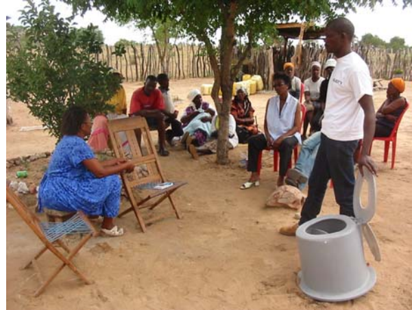
Figura 1: Taller comunitario

En los próximos cinco años, un proyecto dedicado a la gestión sustentable de recursos regionales colaborará con las autoridades locales, la Unión Internacional para la Conservación de la Naturaleza (UICN) y el Servicio Alemán para el Desarrollo (DED, por sus siglas en alemán) para desarrollar, probar y demostrar la gestión de aguas residuales, y métodos y sistemas de saneamiento sustentables y descentralizados. En un comienzo, se vincularán al proyecto de investigación viviendas particulares en los distritos de Ghanzi, Gaborone y Serowe. Posteriormente, el enfoque será extendido a nivel municipal. Una de las metas de este proyecto GTZ es la recuperación de nutrientes y oligoelementos a partir de las aguas residuales domésticas, las heces fecales y la orina para su uso en agricultura. De este modo no sólo se contribuye a fomentar la seguridad alimentaria a largo plazo, sino que se proporciona a las personas una oportunidad para ganar dinero adicional.