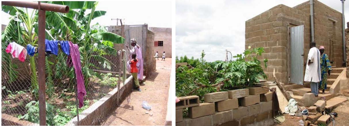
Figura 3: Jardín de aguas grises y módulo experimental de saneamiento

Koulikoro cuenta con un sistema centralizado de suministro de agua potable que data de los años setenta, pero no cuenta con un sistema de drenaje. En un país árido, ubicado al sur del Sahara, como Malí, en el que los recursos hídricos y económicos son escasos, los sistemas de arrastre de agua similares a los usados en Europa son inapropiados y demasiado costosos. Malí se enfrenta también al problema creciente de la degradación del suelo, incluyendo la desertificación, principalmente por el uso agrícola intensivo y la insuficiente devolución de nutrientes.