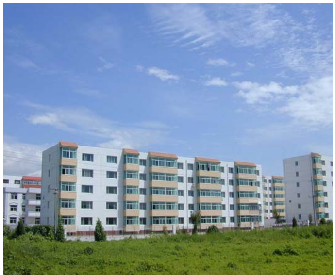
Figura 5: Nueva zona habitacional en Yang Song