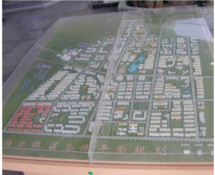
Figura 4: Modelo del Plan de Desarrollo Yang Song

Existen también planes para usar la tecnología de vacío para ahorro de agua y sistemas desviadores de orina. Se recolectarán los residuos orgánicos de las cocinas y los mercados, los cuales serán triturados y fermentados en un sistema bio-reactor. El fertilizante resultante y la orina desinfectada podrán ser utilizados para el cultivo de flores y hortalizas. Las aguas grises serán usadas para regar jardines y parques públicos.