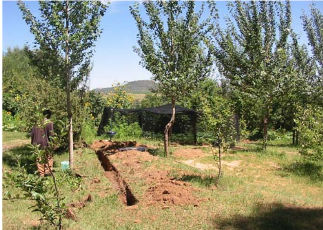
Figura 7: Trabajo de construcción en Lesotho

Con apoyo de la Embajada Alemana, el Servicio Alemán para el Desarrollo (DED) está realizando algunas medidas de capacitación y demostración en la reutilización in situ de aguas residuales y nutrientes con un enfoque de ciclo cerrado centrado en la vivienda y la comunidad, y guiado por un enfoque de viabilidad económica.