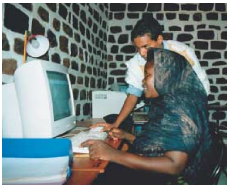
Aus Aioun die Welt: Den Frauen in der CyberCommune eröffnen sich neue Horizonte.