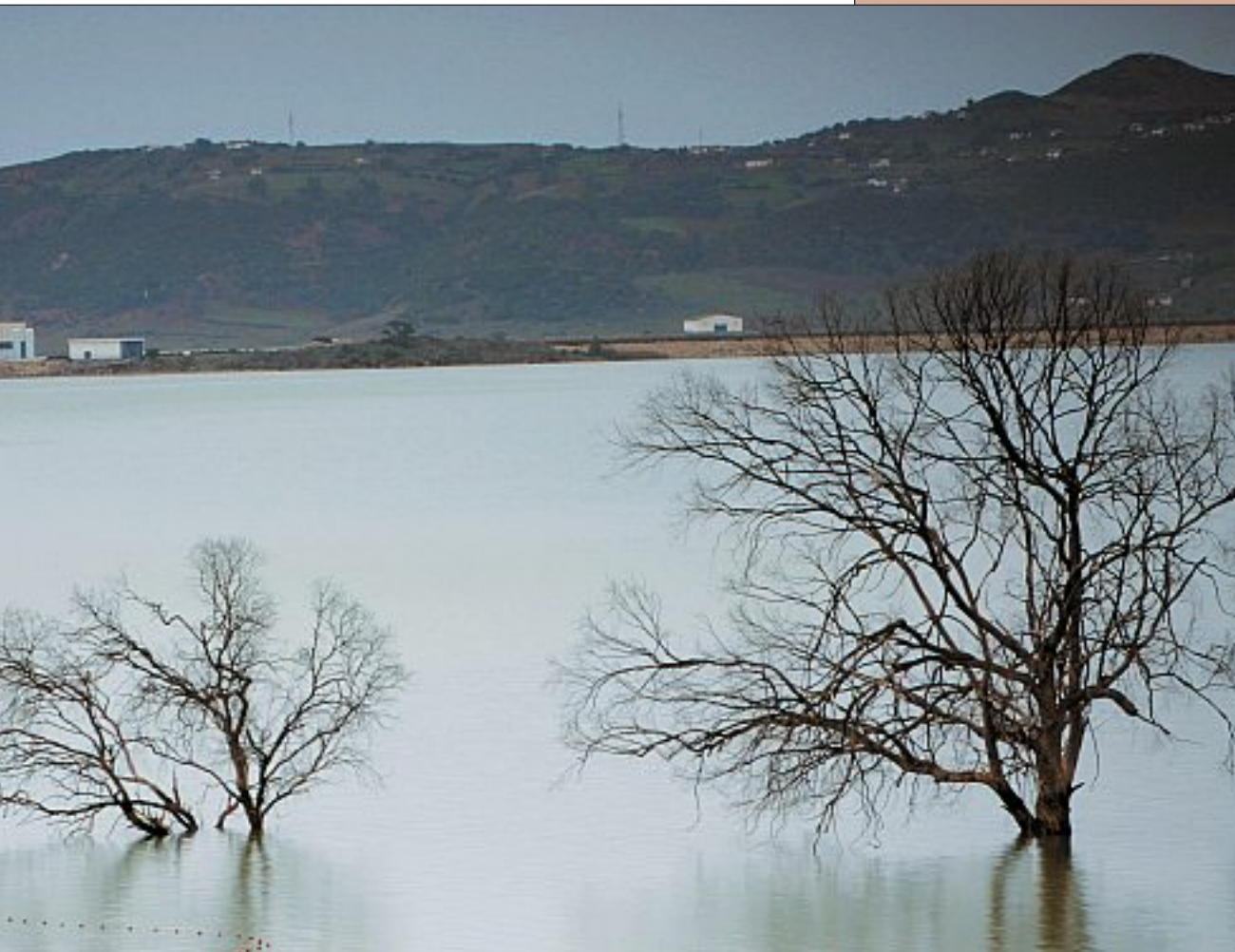
Tunesien: Überschwemmung als Folge von extremen Niederschlägen und fehlender Drainage. Gleichzeitig dehnt sich an anderer Stelle die Wüste aus.